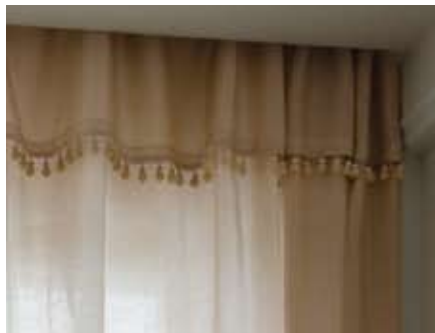
19 バランス付フラットカーテン