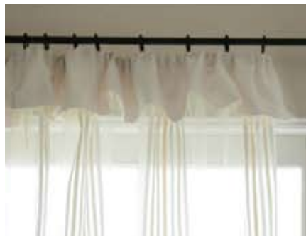
20 フレアーバランス付ギャザーカーテン