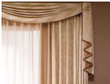
23 トリム付スワッグ&テールバランス (シングル)