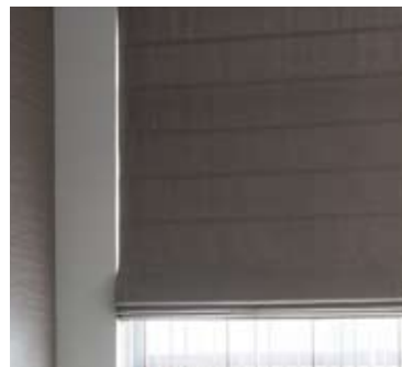
14 | シャープシェード

シェードの折目にバーを入れ規則正しく昇降させる、よりモダンなローマンシェードスタイル