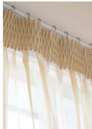
9 スモックギャザーカーテン