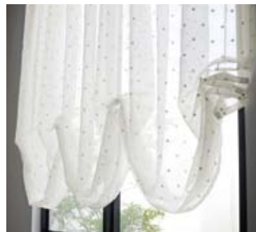
16 | バルーンシェード (フリルなし)

シェードの折目にバーを入れ規則正しく昇降させる、よりモダンなローマンシェードスタイル