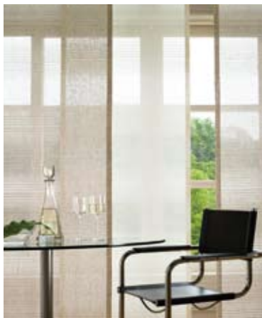
10 | パネルカーテン