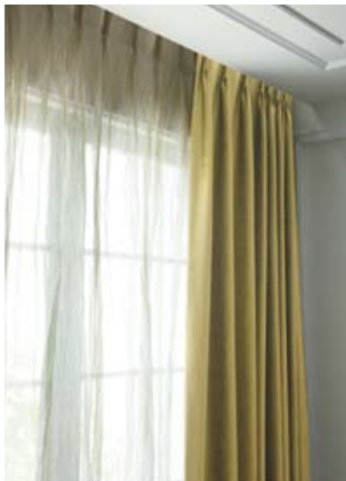
1 レギュラーカーテン

マナテックスVol.14に掲載されているカーテンスタイルをご紹介します。 スタイル検討の際にご参照ください。