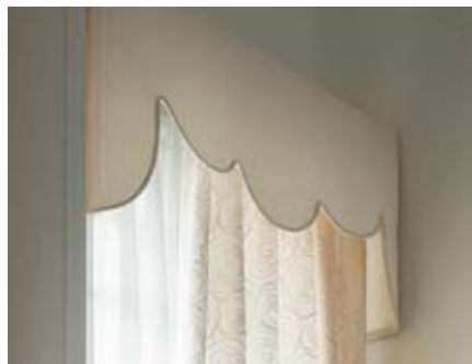
22 変形ストレートバランス