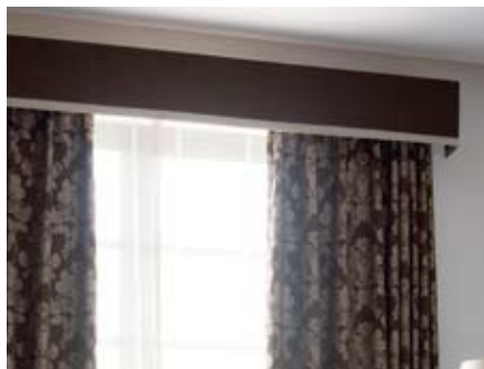
21 ストレートバランス