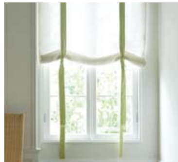
18 | リボン付ルーズロールアップシェード