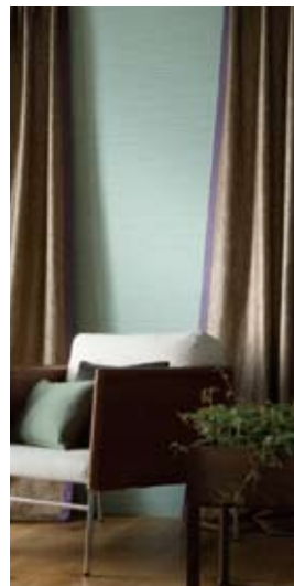
3 I型・L型フレーム付カーテン