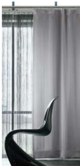
2 フラットカーテン