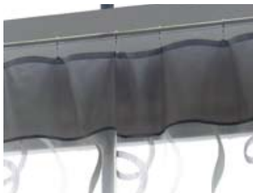
11 | クリップ留めカーテン