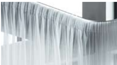
8 ペンシルプリーツ(ギャザーカーテン)