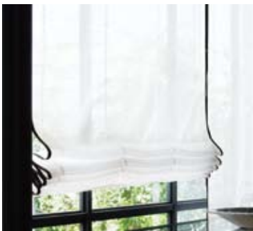
13 | プレーンシェード

フラットな生地を上下に昇降させるローマンシェードスタイル (写真は極細サイドフレーム付となります)