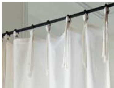
12 | リボンスタイルカーテン