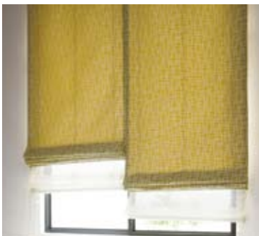
15 | ツインシェード

フラットな生地を上下に昇降させるローマンシェードスタイル (写真は極細サイドフレーム付となります)