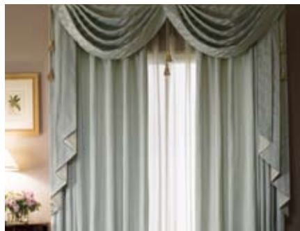
24 スワッグ&テールバランス (ダブル)