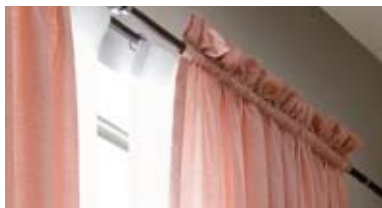
5 パイプ通しカーテン